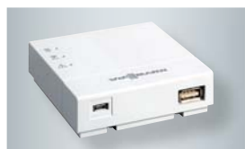
Vitoconnect mit Anschlüssen für das Steckernetzteil (links) und zur Datenverbindung