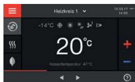
5-Zoll-Farb-Touch-Display der Regelung Vitotronic 200 (Typ HO2B)

* Voraussetzungen und Produktübersicht unter www.viessmann.de/garantie